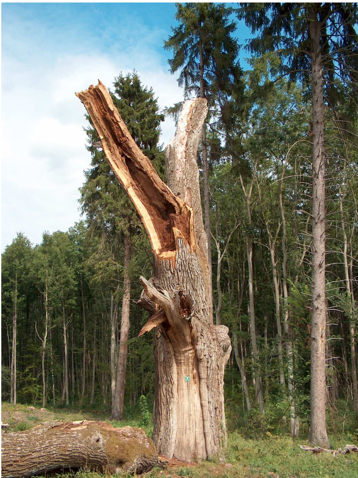
Fot.4. Pomnik przyrody, leśnictwo Chycina oddz. 47f.

Na gruntach Nadleśnictwa Międzyrzecz znajdują się 34 pomniki przyrody. Są to pojedyncze drzewa, grupy drzew, aleje oraz powierzchniowe pomniki przyrody. Ich wykaz zamieszczono poniżej: