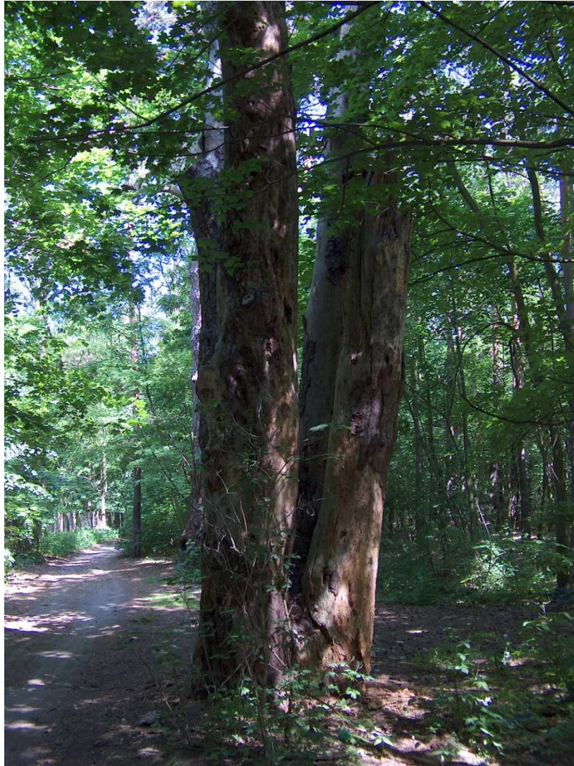
Fot.3. Pomnik przyrody, leśnictwo Bobowicko oddz. 197m.