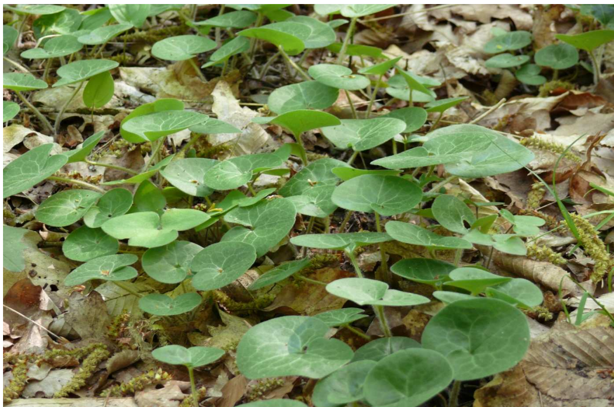
Fot.10. Kopytnik pospolity.