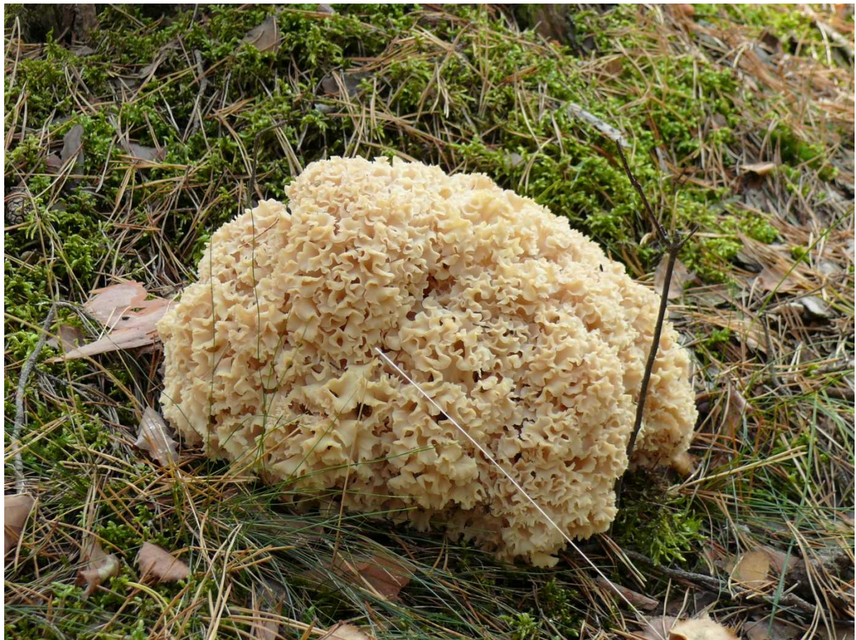
Fot.9. Owocnik szmaciaka gałęzistego.

Określając listę gatunków grzybów i roślin chronionych, zagrożonych i rzadkich opierano się na terenowych pracach urzędniowych (BULiGL O/Gorzów Wlkp. 2008 r.), waloryzacjach przyrodniczych gmin obejmujących zasięgiem teren Nadleśnictwa Międzyrzecz, waloryzacji przyrodniczej nadleśnictwa.