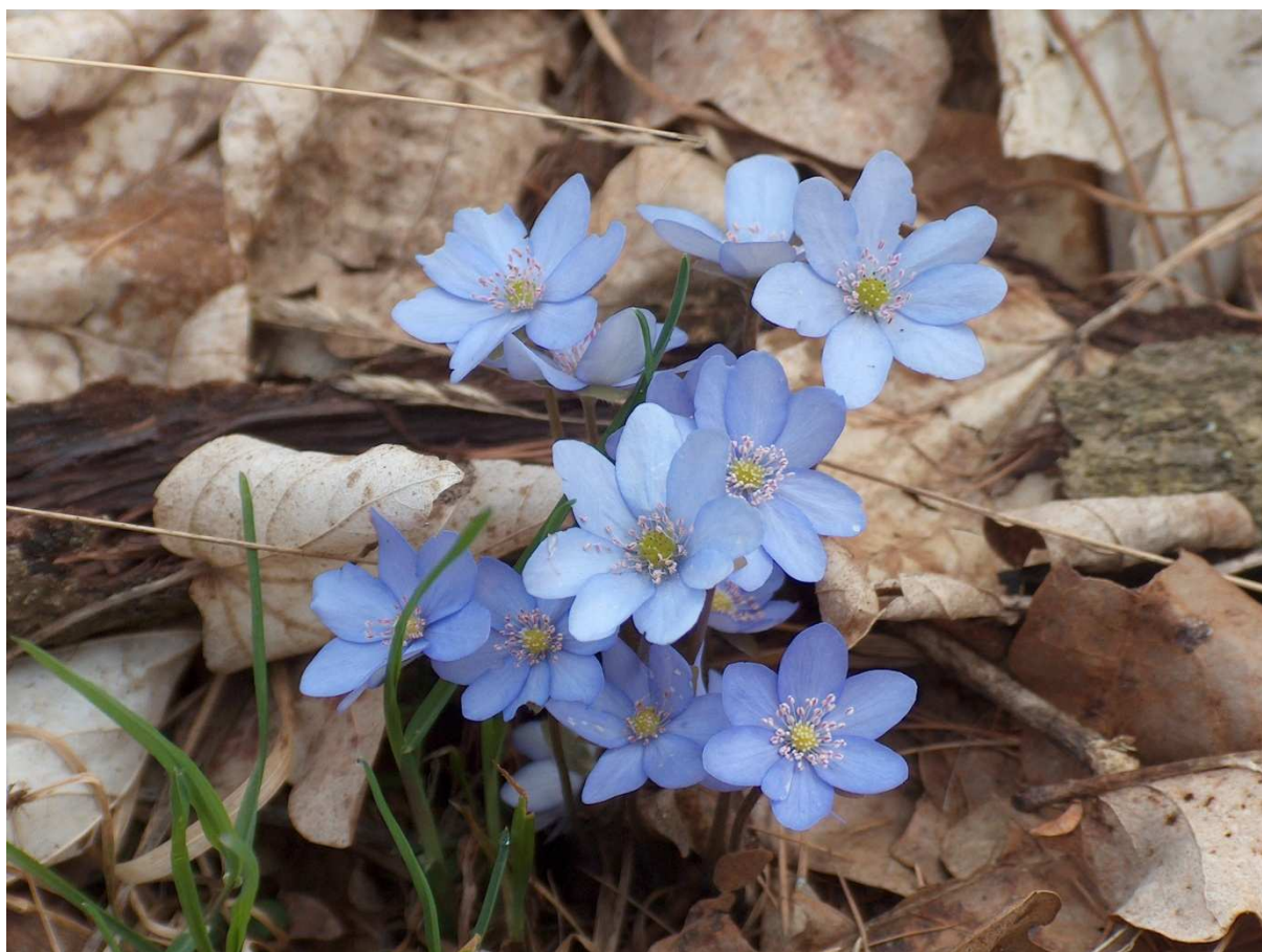
Fot.11. Przylaszczka pospolita.