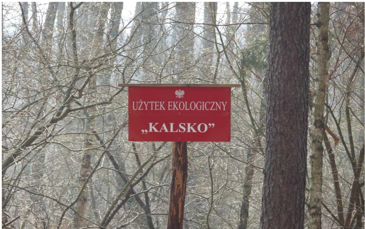
Fot.2. Tablica informacyjna przy użytku ekologicznym.