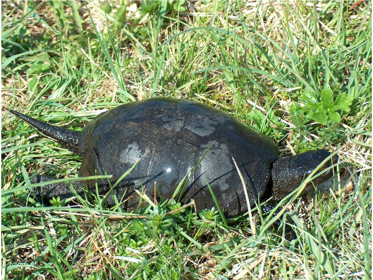
Fot.12. Żółw błotny.

Określając listę gatunków zwierząt (bezkęgowców i kręgowców) chronionych, zagrożonych i rzadkich opierano się na terenowych pracach urządzeniowych (BULiGL O/Gorzów Wlkp. 2008 r.), waloryzacji przyrodniczej nadleśnictwa oraz poprzednim „Programie Ochrony Przyrody”.