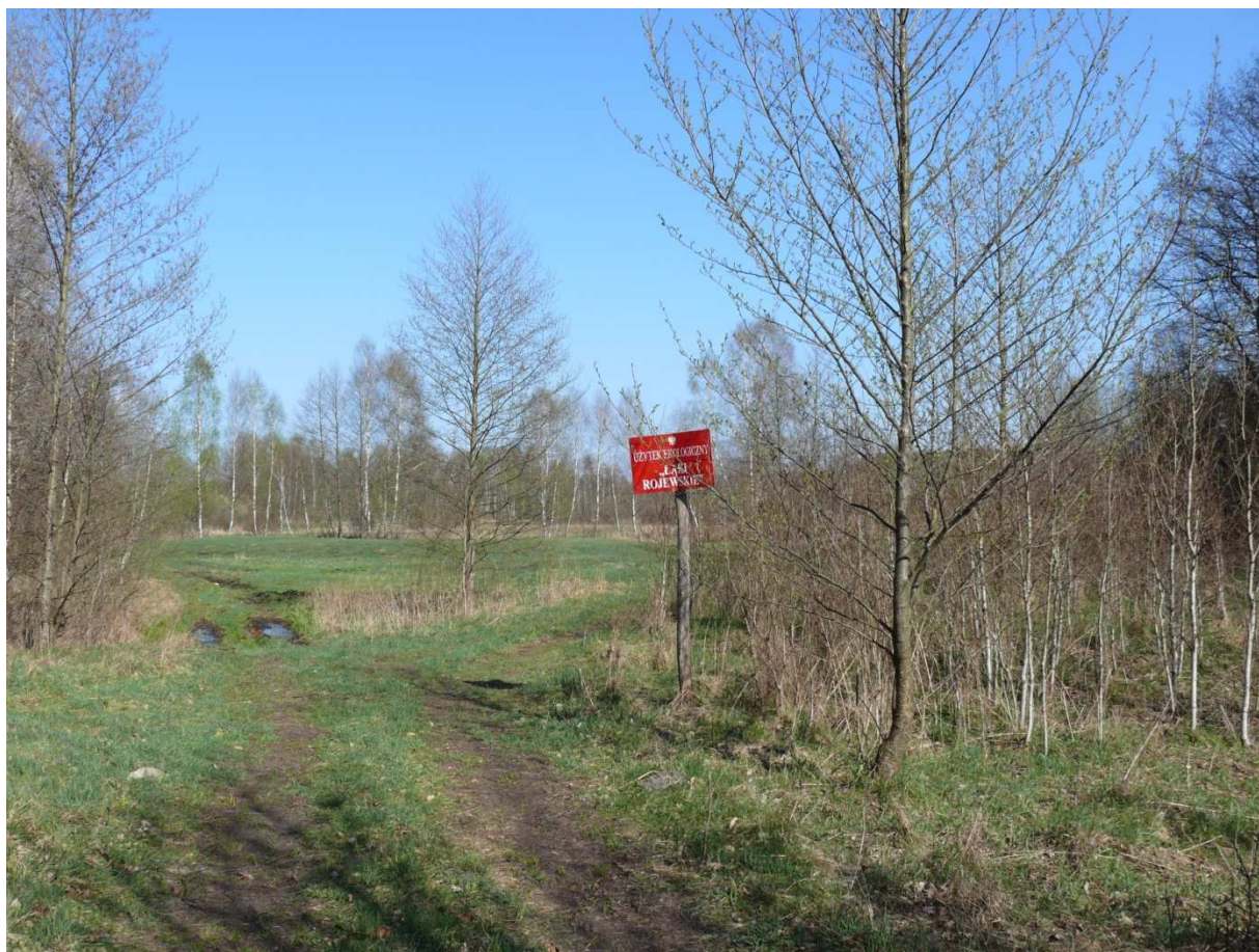
Fot.7. Użytek ekologiczny „Łąki Rojewskie”.