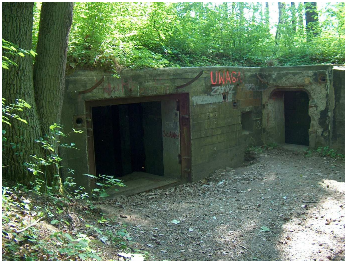
Fot.8. Pozostałości budowli MRU, leśnictwo Kursko oddz. 378d.