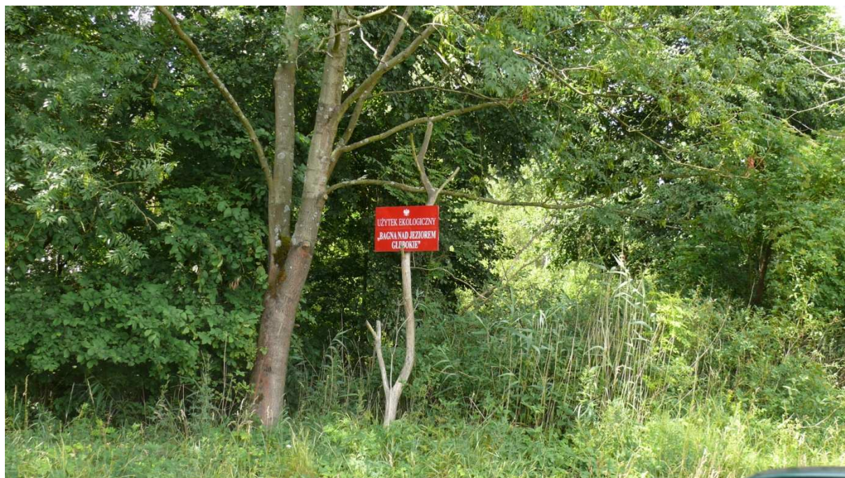
Fot.6. Użytek ekologiczny „Bagna nad Jeziorem Głębokie”