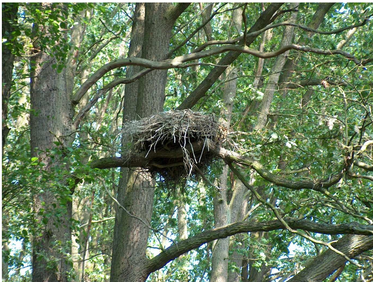
Fot.13. Gniazdo bociana czarnego.

Strefy ochronne w Nadleśnictwie Międzyrzecz utworzone zostały decyzjami: