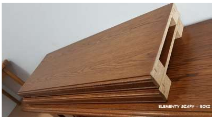
ELEMENTY SZAFY - BOKI