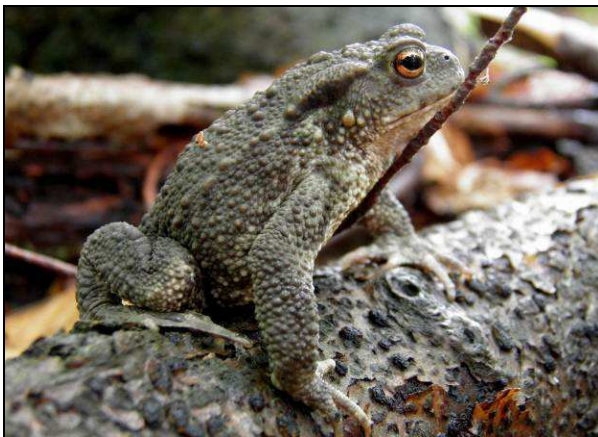
Fot. 23. Ropucha szara Bufo bufo (ochrona ścisła) – oddz. 125p l-ctwo Gniewomierz.