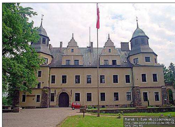
Fot. 4. Pałac w Goraju obecnie Zespół Szkół Leśnych.