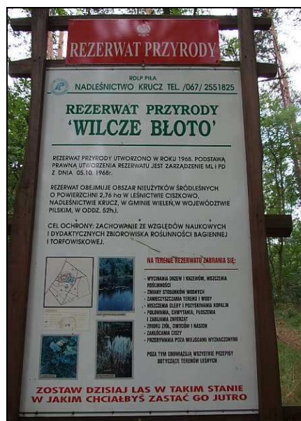
Fot. 6. Tablica informacyjna przy rezerwacie przyrody „Wilcze Błoto” – l-ctwo Ciszkowo.