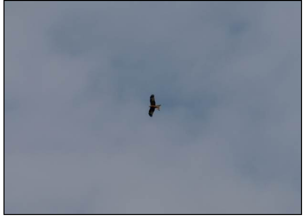
Fot. 20. Kania ruda Milvus milvus z terenu Nadleśnictwa (ochrona ścisła).