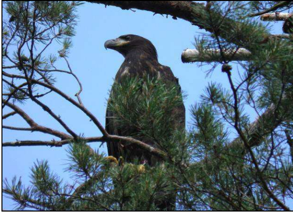
Fot. 19. Młody bielik Haliaeetus albicilla –l-ctwo Gniewomierz (ochrona ścisła).