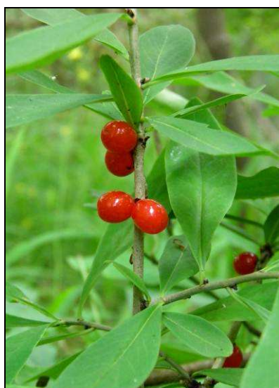
Fot. 17. Wawrzynek wilczełyko Daphne mezereum (ochrona ścisła) – oddz. 14f l-ctwo Goraj.