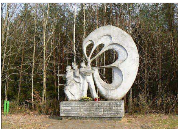
Fot. 3. Pomnik radzieckich i polskich spadochroniarzy - oddz. 407h, l-ctwo Annogóra.