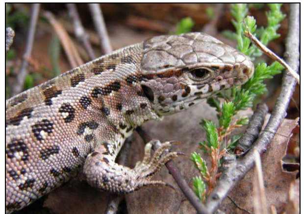
Fot. 24. Jaszczurka zwinka Lacerta agilis (ochrona ścisła) – oddz. 137a l-ctwo Biała.