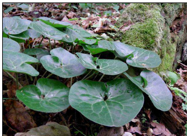
Fot. 16. Podlegający ochronie częściowej kopytnik pospolity Asarum europaeum – oddz. 2c l-ctwo Goraj.