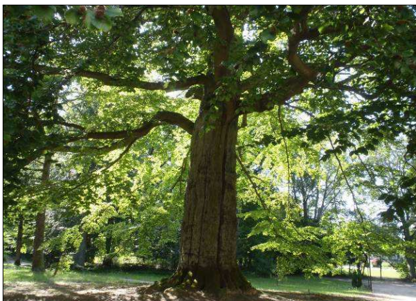
Fot. 7. Pomnik przyrody –buk zwyczajny.