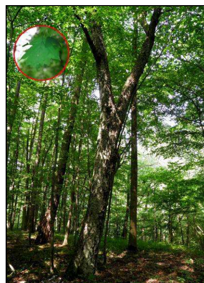
Fot. 18. Jarzqb brekinia Sorbus torminalis (ochrona ścisła) – oddz. 38g l-ctwo Goraj.