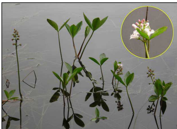
Fot. 11. Podlegający ochronie częściowej bobrek trójlistkowy Menyanthes trifoliata na brzegu jeziorko dystroficznego – oddz. 260h.