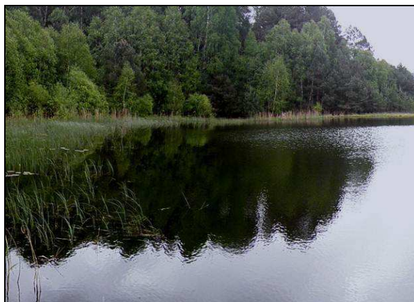
Fot. 10. Siedlisko przyrodnicze 3160 jeziorko dystroficzne – oddz. 260h l-ctwo Biała.