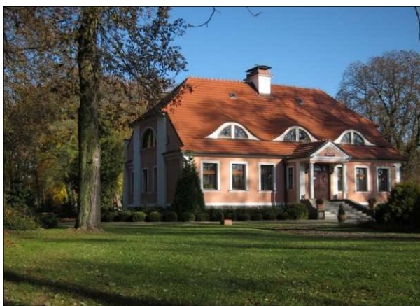
Fot. 1. Siedziba Nadleśnictwa Krucz.