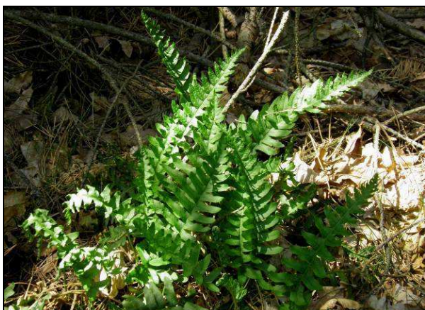
Fot. 15. Gatunek podlegający ochronie ścisłej paprotka zwyczajna Polypodium vulgare – oddz. 18h l-ctwo Goraj (fot. Michał Błaszczak).