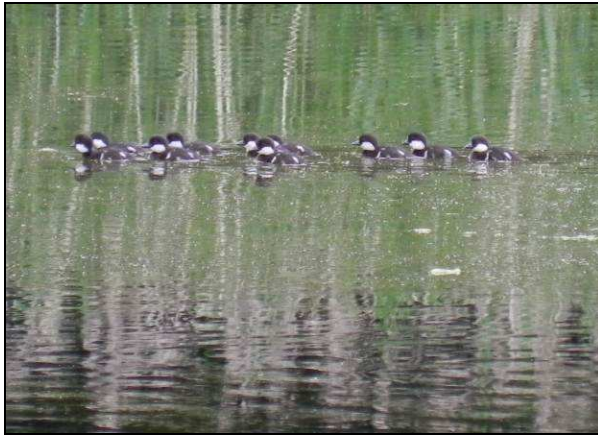
Fot. 21. Pisklęta gagota Bucephala clangula z terenu Nadleśnictwa (ochrona ścisła).