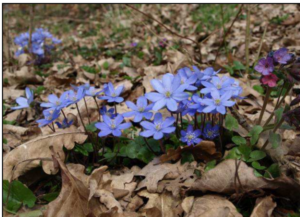
Fot. 13. Podlegająca ochronie ścisłej przylaszczka pospolita Hepatica nobilis –Morena Czarnkowska.