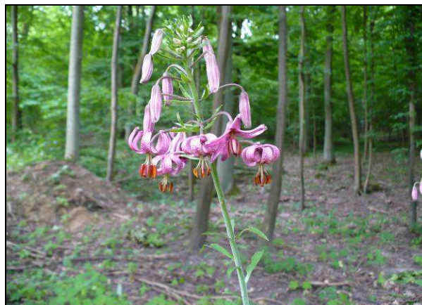
Fot. 14. Lilia złotogłów Lilium martagon z terenu Nadleśnictwa – ochrona ścisła.