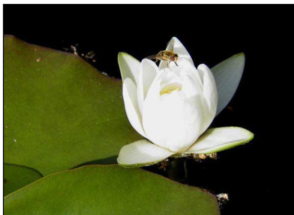
Fot. 12. Podlegające ochronie częściowej grzybień białe Nymphaea alba – oddz. 66d l-ctwo Ciszkowo.