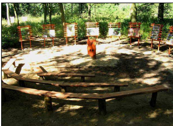
Fot. 5. Zielona klasa – fragment ścieżki edukacyjnej.