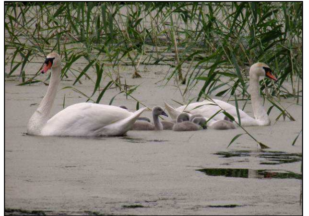
Fot. 22. Łabędź niemy Cygnus olor (ochrona ścisła) – oddz. 436b l-ctwo Klempicz.