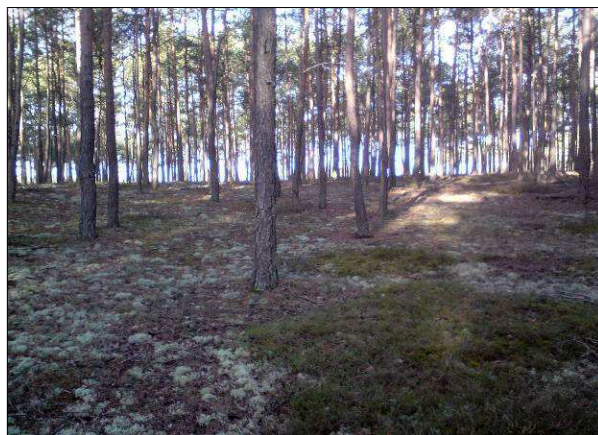
Fot. 8. Siedlisko przyrodnicze 91T0 sosnowy bór chrobotkowy – oddz. 327a l-ctwo Klempicz.