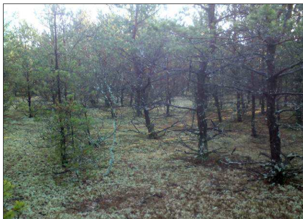
Fot. 9. Siedlisko przyrodnicze 91T0 sosnowy bór chrobotkowy – oddz. 450a l-ctwo Smolary.