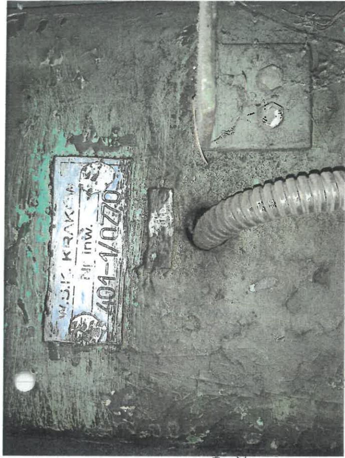
inż. Zdzisław Szpyt RZECZOZNAWCA Nr zpr. 0120