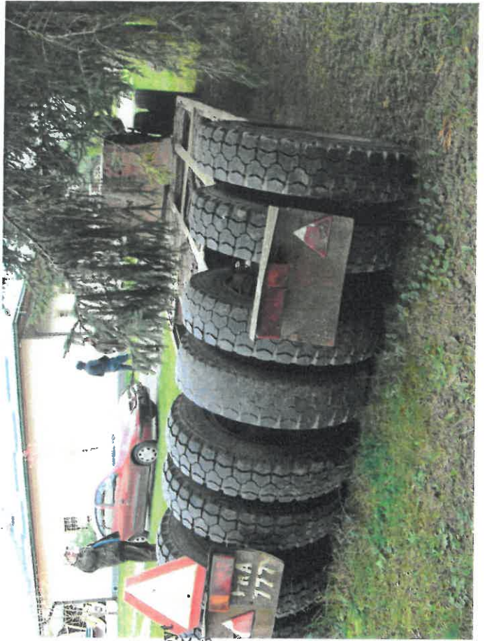
Zdzisław Szpyt DZIAWKA SITK i. 6 / 2012