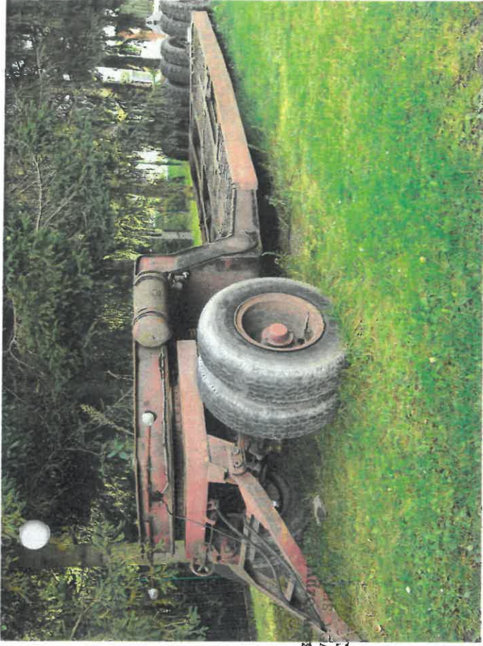
inż. inż. Zdzisław RZECZOZNAWA INF. 4.1. 01