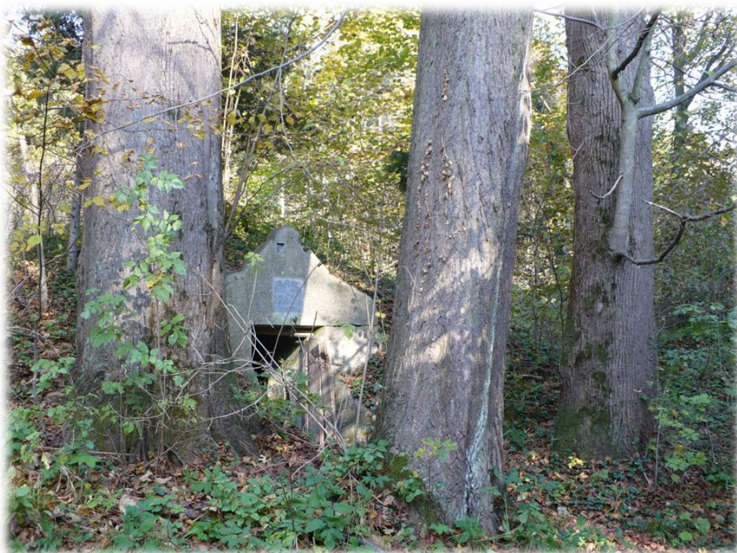
Fot. Ruiny zabudowań wodociągu doprowadzającego wodę do zamku Potockich. w Łańcucie, wybudowany w 1893 r. Leśnictwo Trnawka, oddz. 41Ai.