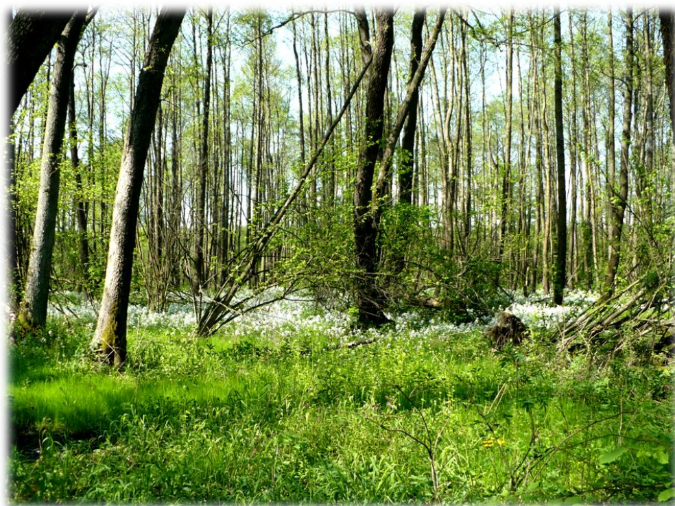
Fot. Wiosna na bagnach, leśnictwo Roźwienica, oddz. 46f.