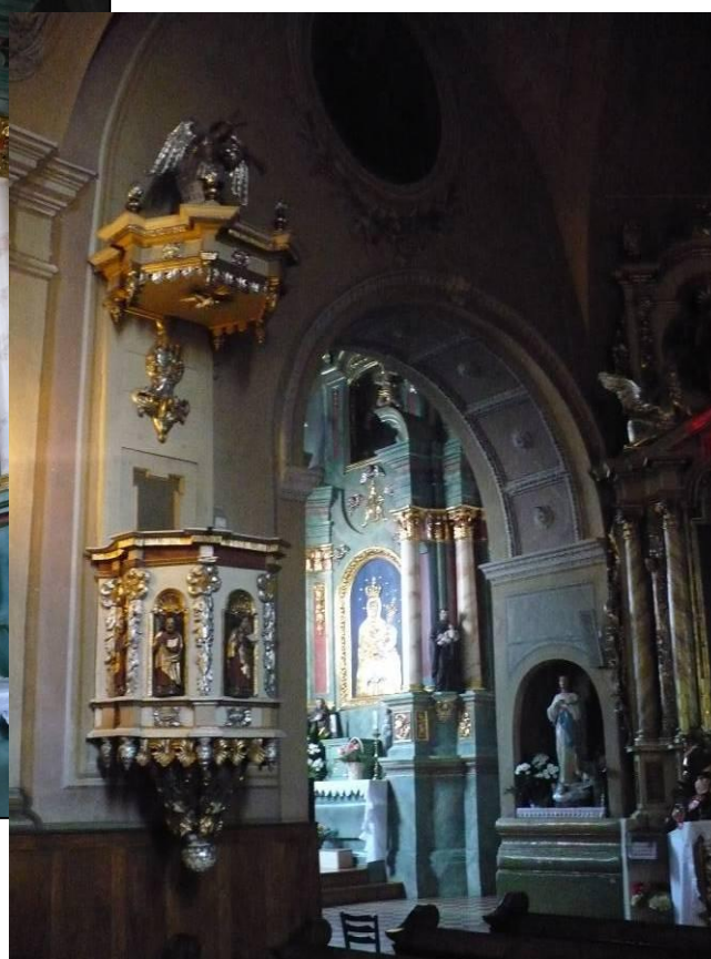
Fot. Zabytkowy kościół par. p.w. św. Michała Archanioła w Kańczudze.