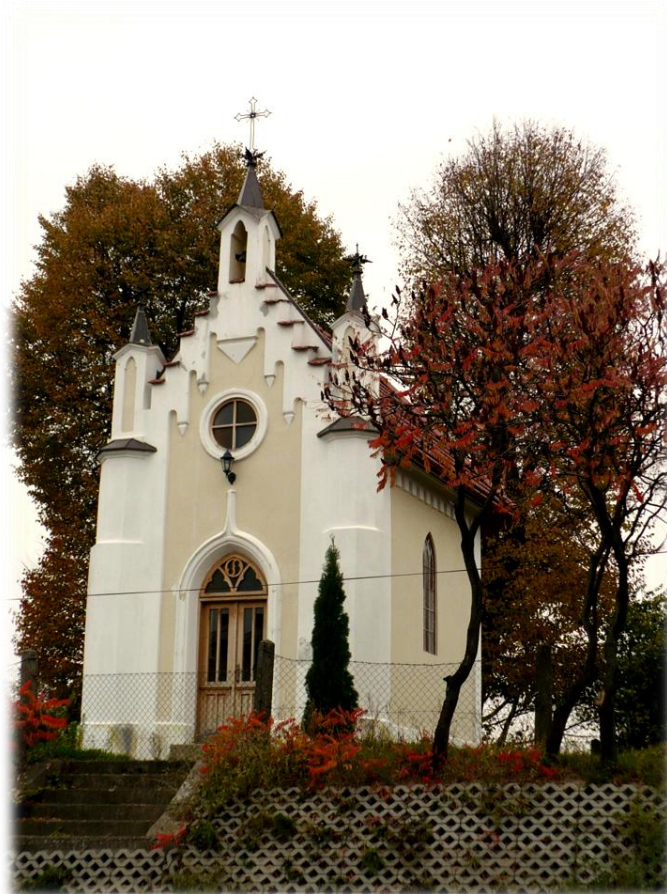
Fot. Kaplica św. Barbary z 1890 r. w Kańczudze.