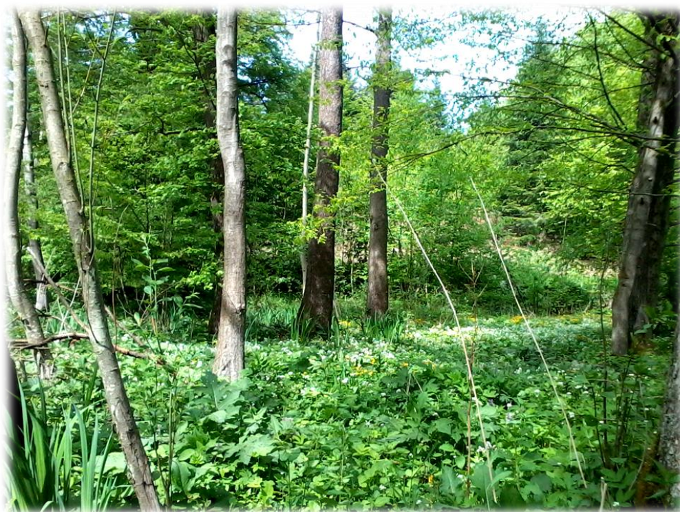
Fot. Dawne koryto cieków wodnych. Stanowiska gatunków roślin chronionych - leśnictwo Tarnawka, oddz. 66j.