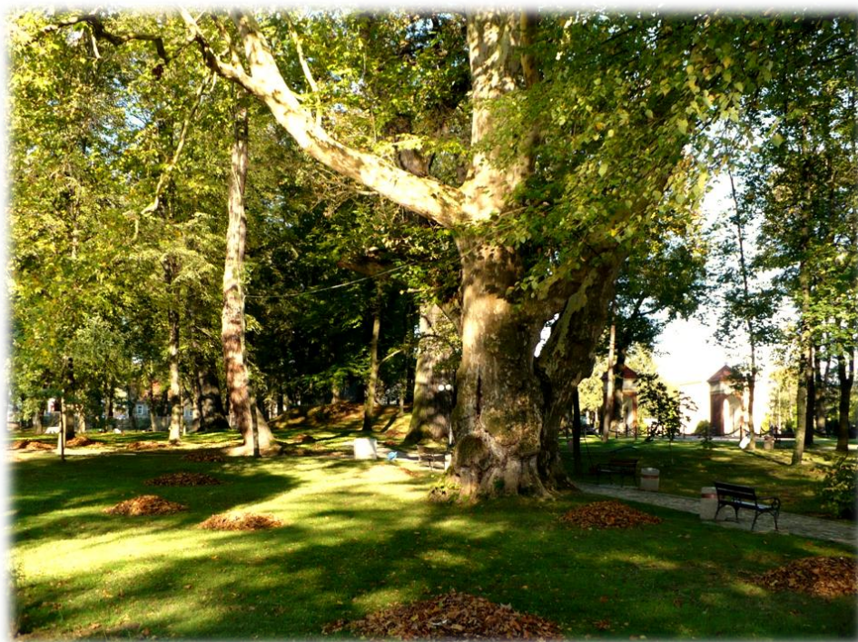
Fot. Okazały platan klonolistny przy jednej z alej w parku dworskim w Dubiecku.

Lipnik: Jest to jeden z nielicznych, dwudziestowiecznych parków leśnych o bogatym składzie florystycznym, zarówno gatunków krajowych, jak i obcych. Zachowany jest w całości jednorodny układ przestrzenny według pierwszego rozplanowania, wraz z aleją grabową, lipową jesionową oraz sadem jabłoniowym.