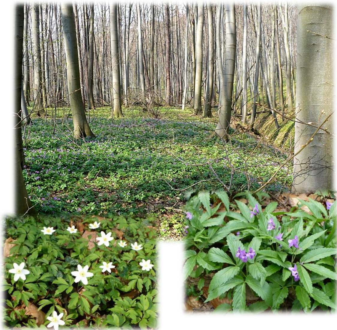
Fot. Wiosenny aspekt żyznej buczyny karpackiej w formie podgórskiej Dentario glandulosae – Fagetum collinum w oddz. 33a.

Na uwagę zasługują również 3 okazałe buki o wymiarach pomnikowych oraz 1 egzemplarz kwitnącego bluszczu pospolitego Hedera helix pnącego się po dębie. Do osobliwości rezerwatu należy 150 letni drzewostan modrzewiowy, którego budują okazałe, w większości pomnikowe egzemplarze modrzewia europejskiego Larix europaea .