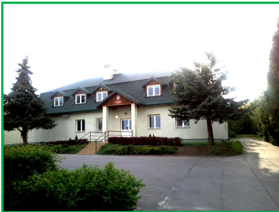
Fot. Siedziba Nadleśnictwa Kańczuga.

Siedziba Nadleśnictwa znajduje się w mieście Kańczuga, przy ulicy Węgierskiej nr 32 (oddz. 20m, obręb Kańczuga) w odległości około 0,5 km od Urzędu Miasta w Kańczudze.