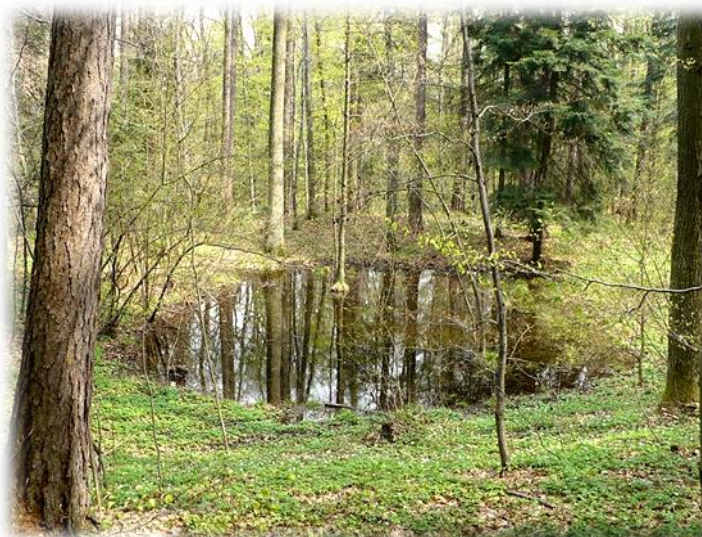
Fot. Oczka wodne, leśnictwo Lipnik, oddz. 10d,f.