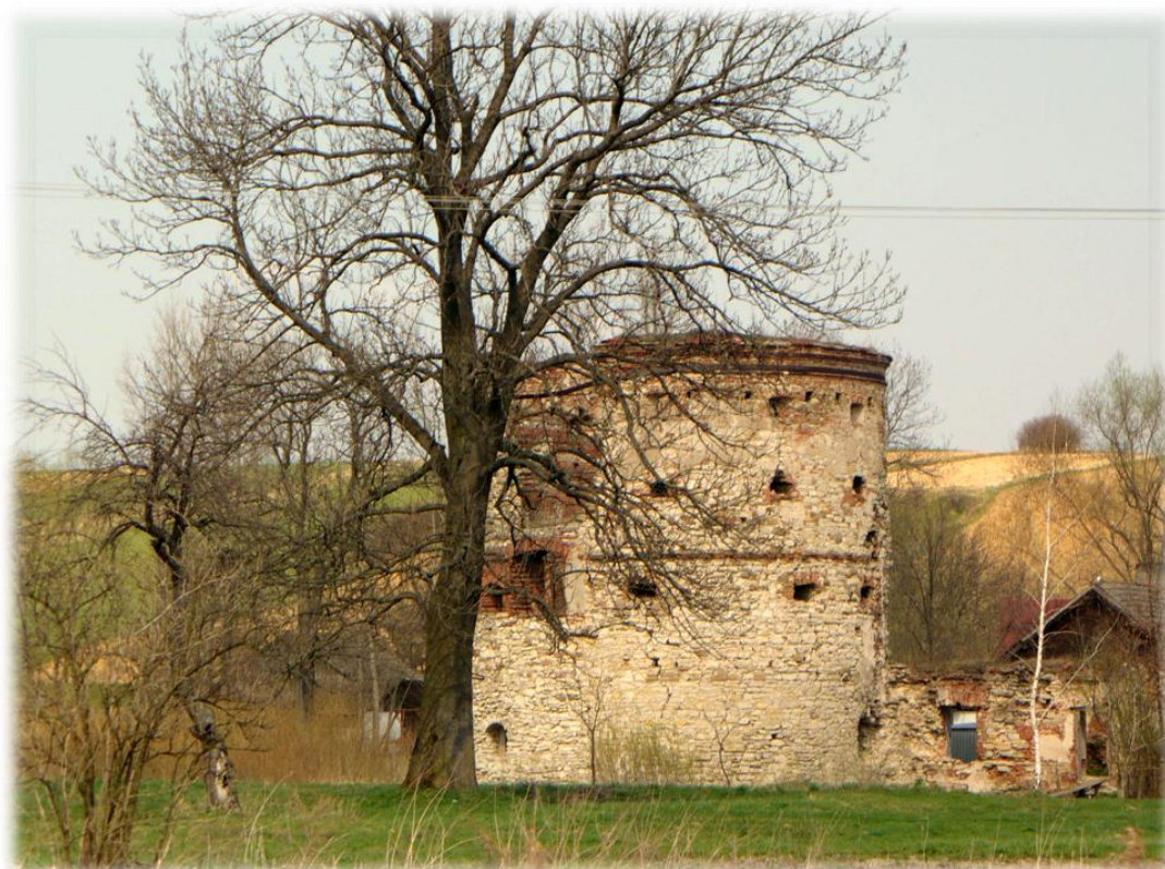
Fot. Baszta - pozostałość zespołu zamkowego (siedziba Pruchnickich i Pieniążków, XVI-XVII w.).