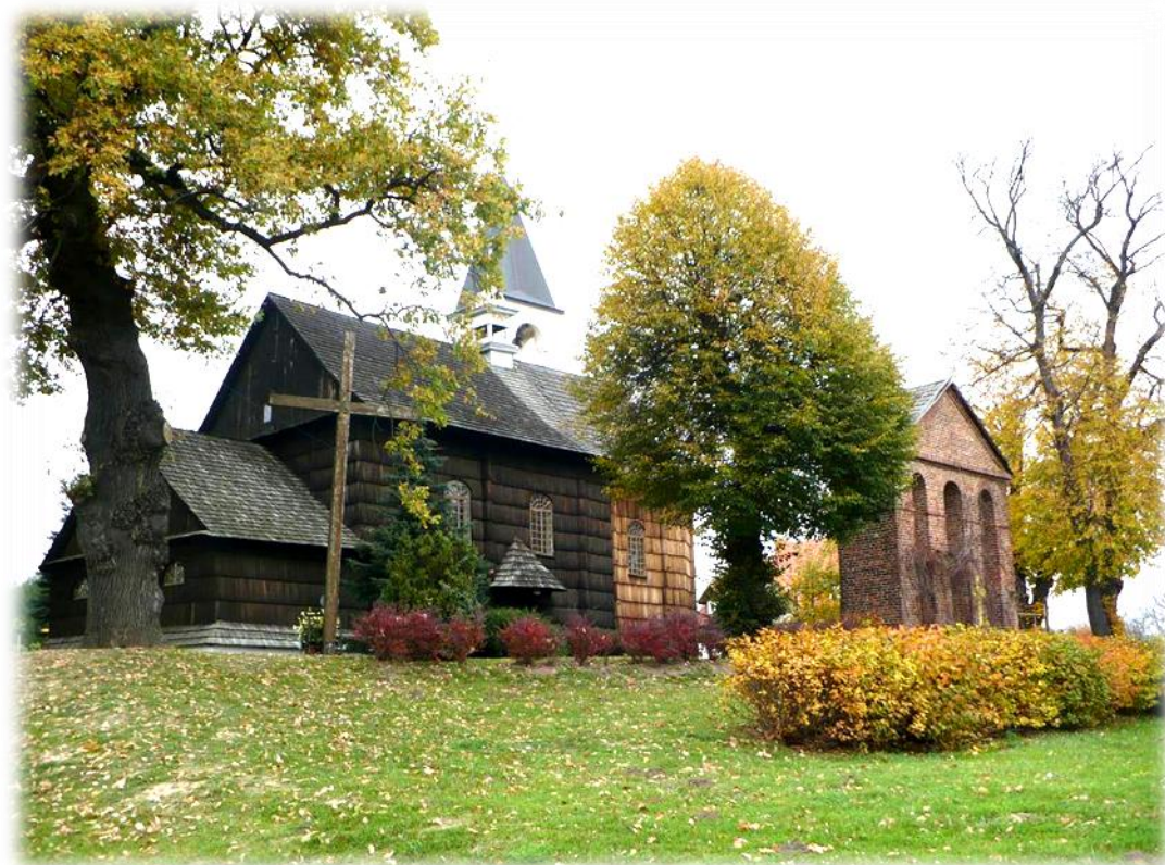
Fot. Zabytkowy drewniany kościół p.w. Wszystkich Świętych wzniesiony w 1676 roku w Siennowicach.