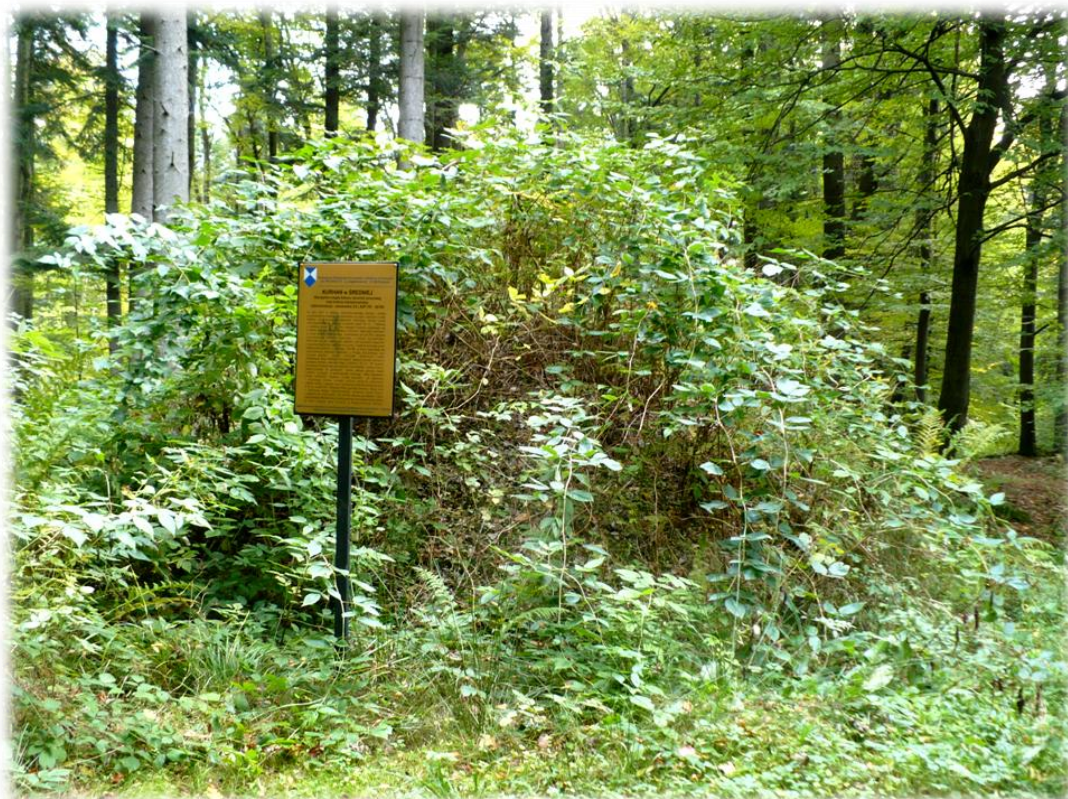
Fot. Cmentarzysko kurhanowe kultury ceramiki sznurowej – neolit. Leśnictwo Borowiec, oddz. 158b.