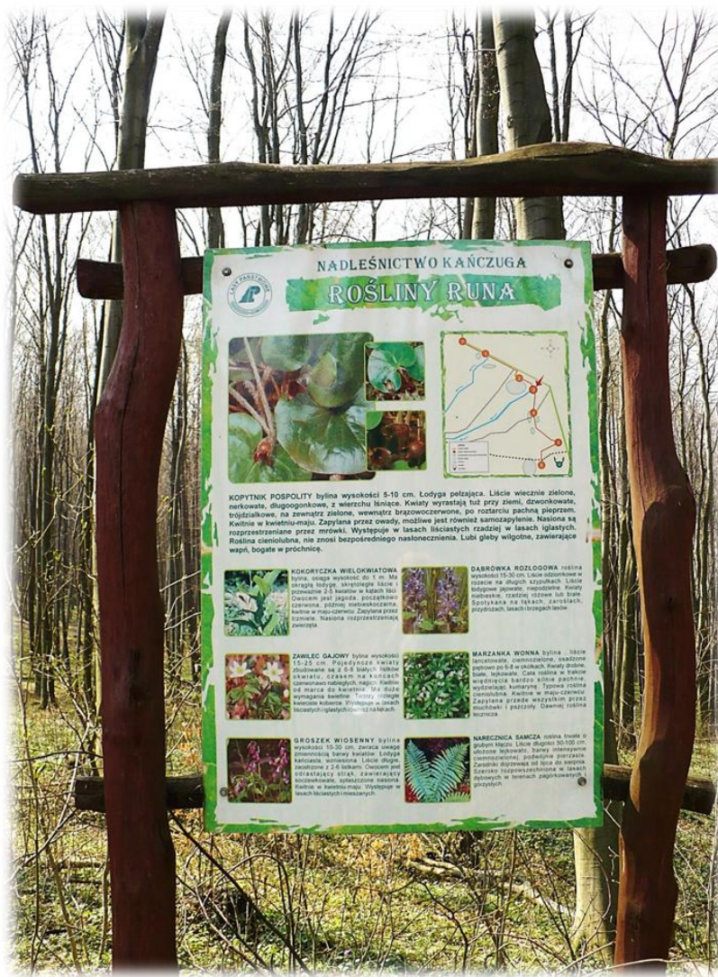
Fot. Przystanek nr 4 „Rośliny runa” przy ścieżce przyrodniczo-dydaktycznej „Husówka”.