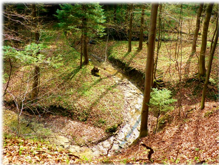
Fot. Meandrujący potok w leśnictwie Lipnik, oddz. 11b.