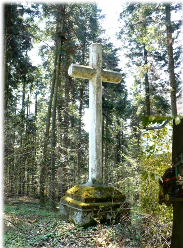
Fot. Krzyż kamienny z 1875 r., leśnictwo Szklary, oddz., 183j.