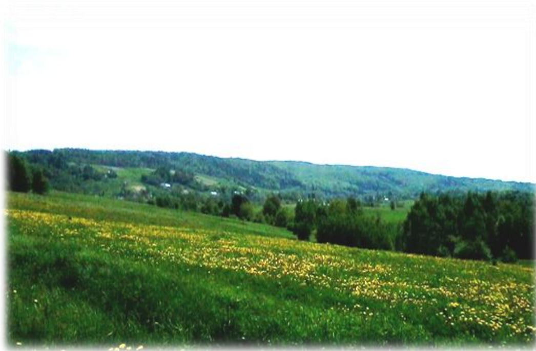
Fot. Panorama Hyżnieńsko-Gwoźnickiego Obszaru Chronionego Krajobrazu.

Powstał on na mocy Rozporządzenia Nr 35/92 Wojewody Rzeszowskiego z dnia 14 lipca 1992 roku w sprawie zasad zagospodarowania obszarów chronionego krajobrazu na terenie województwa rzeszowskiego (Dz. Urz. Woj. Rzeszowskiego Nr 7, poz. 74 z 1992 r.). Najnowszym dokumentem określającym jego powierzchnię, granice, oraz obowiązujące zakazy i nakazy jest Rozporządzenie Nr 77 Wojewody Podkarpackiego z dnia 31 października 2005 r. w sprawie Hyżnieńsko-Gwoźnickiego Obszaru Chronionego Krajobrazu (Dz. Urz. Woj. Podkarpackiego Nr 138, poz. 2103, zm. Nr 149, poz. 2435).