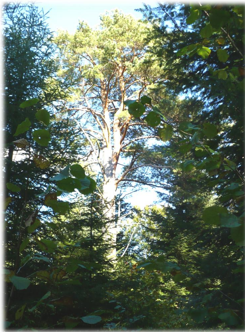
Fot Sosna zwyczajna o obwodzie 313 cm, wysokości 28 m, leśnictwo Śliwnica, oddz. 234a.

Stwierdzono ponadto występowanie kilku okazów kwitnącego bluszczu pospolitego Hedera helix w leśnictwie Rączyna, oddz.: 140d, 142c, 147a,f, 158a;