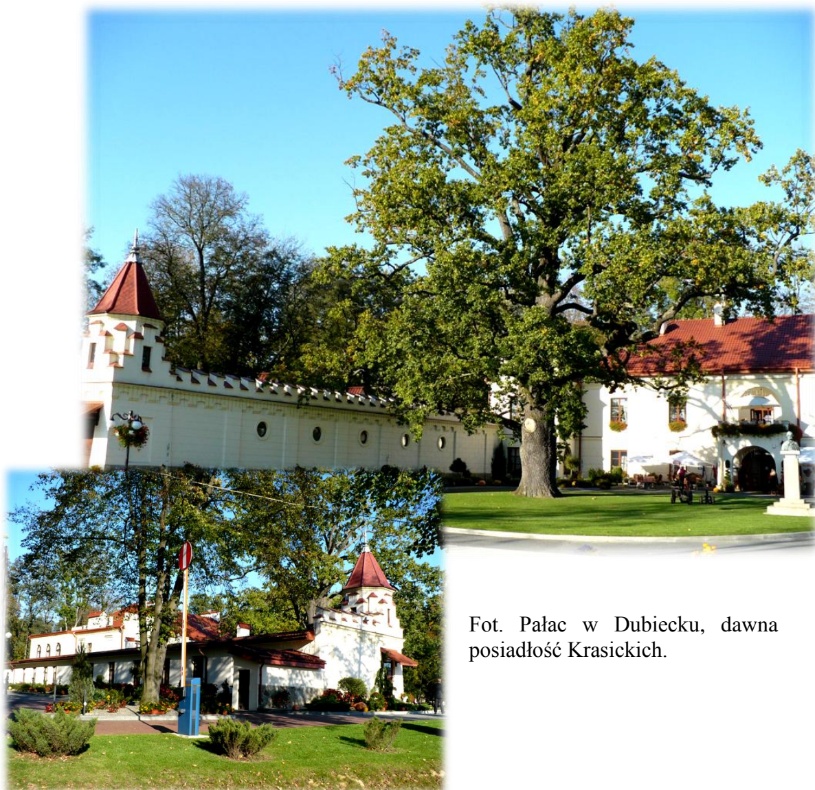
Fot. Pałac w Dubiecku, dawna posiadłość Krasickich.

Na przełomie XVIII i XIX w. pałac przebudowano w stylu klasycyzmu. W latach 1851-1958 należał do hrabiów Konarskich, którzy w 1909 kazali dobudować neogotycką oficynę.