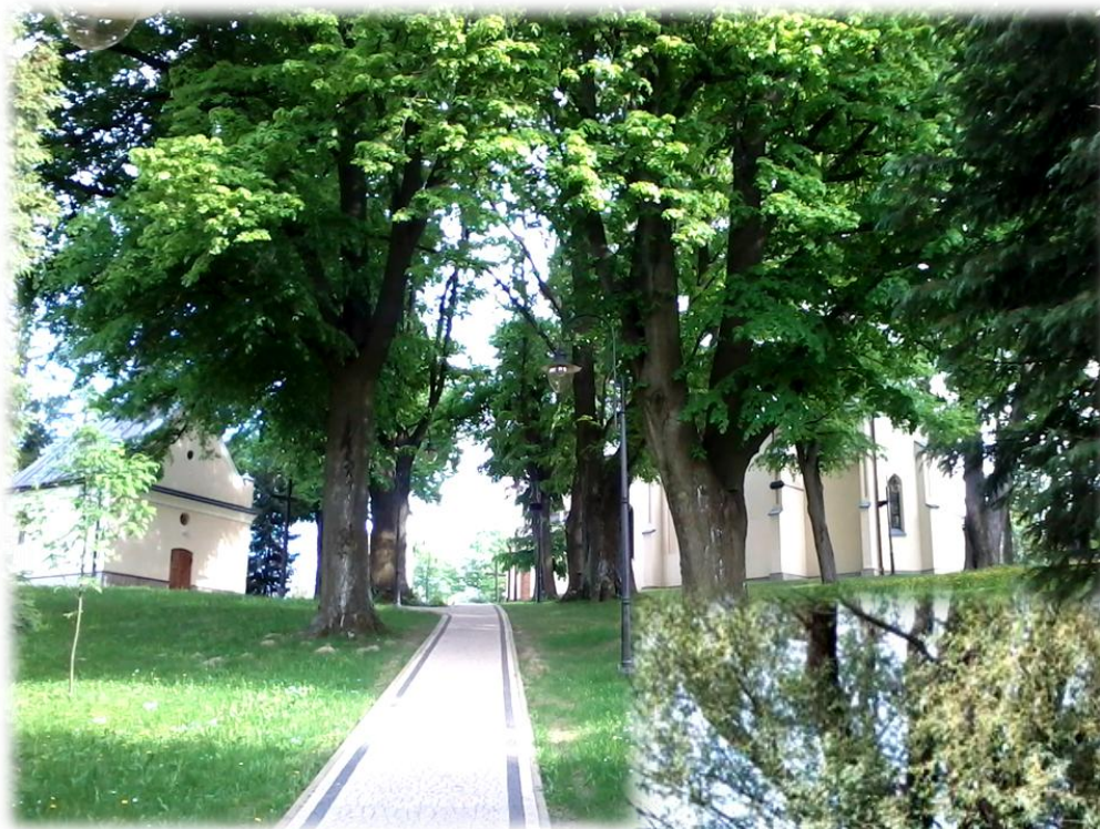
Fot. Grupowy pomnik przyrody nr 1050 (1 wierzba i 29 lip drobnolistnych na terenie parafii kościelnej Jodłówka).