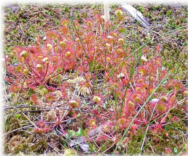
Fot. Rosiczka okrągłolistna Drosera rotundifolia

Fauna reprezentowana jest przez liczne gatunki owadów, a przede wszystkim związanych ze środowiskiem wodnym (ponad 30 gatunków ważek). Występują tutaj chronione i rzadkie gatunki motyli, chrząszczy i innych bezkręgowców. Z gadów możemy spotkać jaszczurkę zwinę, jaszczurkę żyworodną, padalca, żmiję zygzakowatą i zaskrońca. Torfianki wypełnione wodą sprzyjają rozwojowi płazów takich jak: żaba wodna, ropucha szara. W gęstych zaroślach swoje potomstwo wyprowadza: bażant, kuropatwa, strumieniówka, pokrzewka, pierwiosnek, piecuszek, wilga i dziwonia, a wśród szuwarów gniazda swoje buduje kaczka krzyżówka, cyranka i cyraneczka. Z ssaków możemy zobaczyć lisa, kunę leśną, wydrę i sarnę.