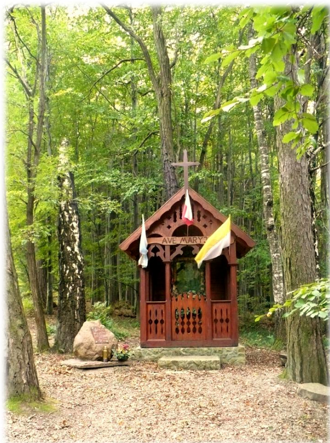
Fot. Drewniana kapliczka, wewnątrz mały ołtarzyk z obrazem Matki Boskiej w brzoźowej ramie. Obok obelisk upamiętniający byłego Nadleśniczego mgr Jerzego Hubickiego. Leśnictwo Borowiec, oddz. 142a.