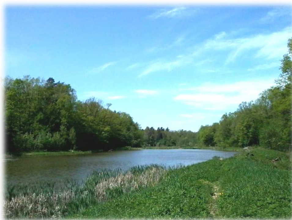
Fot. Stawy w leśnictwie Tarnawka, oddz. 67d.

Ważne znaczenie mają także leśne ekosystemy bagiennie i łąkowe, czyli drzewostany rosnące na siedliskach: Lłwyż, Ol, OlJwyż.