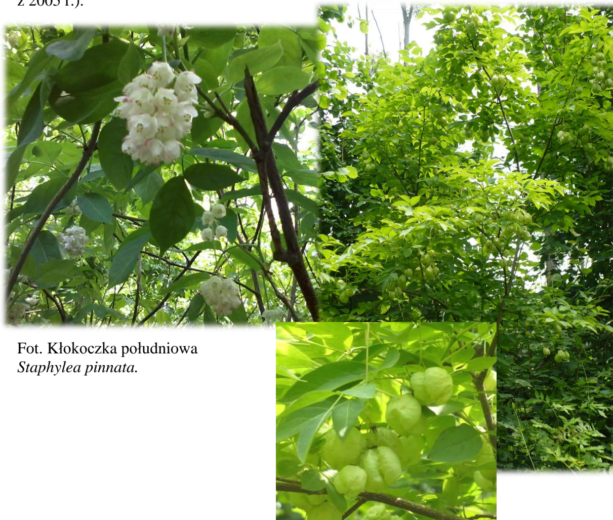
Fot. Kłokoczka południowa Staphylea pinnata .

(klasyfikacja wg głównego typu ekosystemu Rozp. MŚ z dnia 30 marca 2005 r. w sprawie rodzajów, typów i podtypów rezerwatów przyrody; Dz. U. nr 60 poz. 533 z 2005 r.).