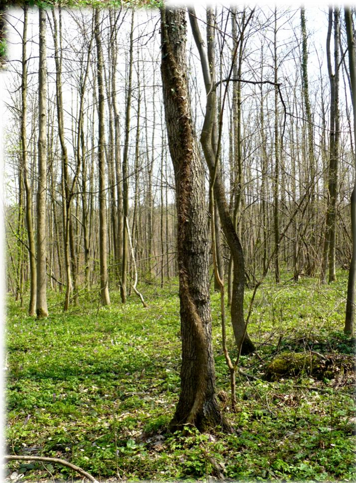
Fot. Forma pnąca bluszczu pospolitego Hedera helix - leśnictwo Rączyna, oddz. 142c