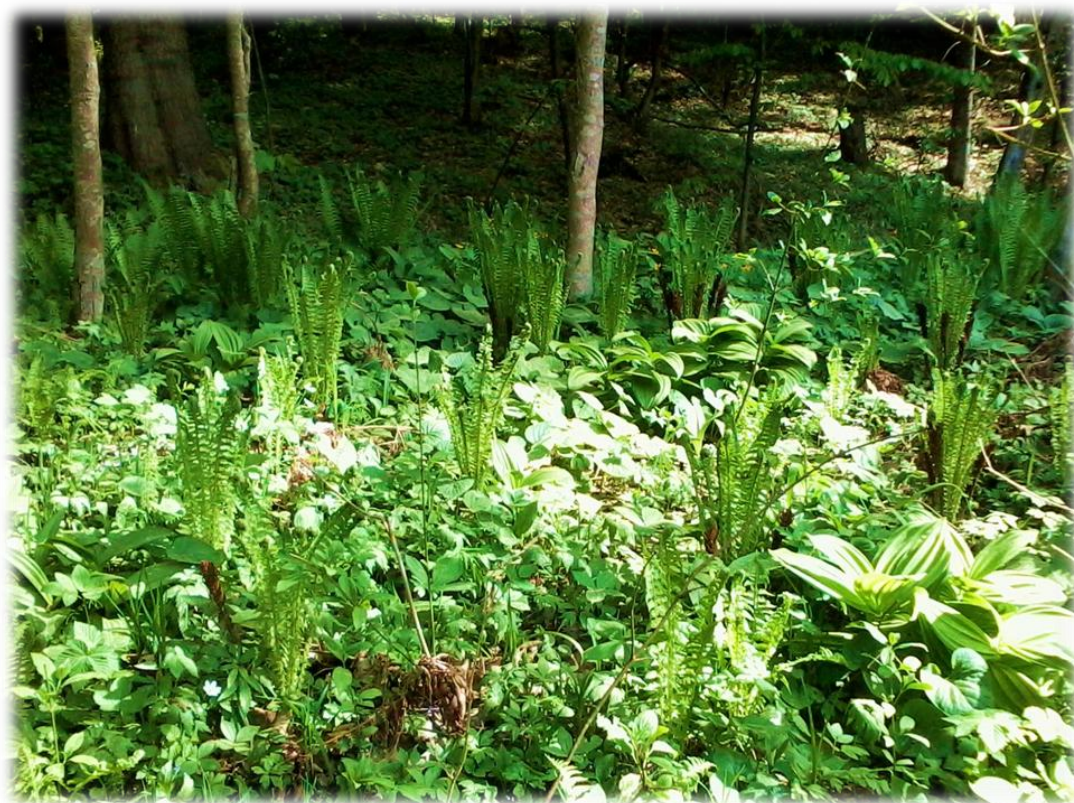
Fot. Stanowisko Pióropusznika strusiego Matteuccia struthiopteris i ciemńycy zielonej Veratrum lobelianum .

Wykaz chronionych gatunków roślin, grzybów i porostów występujących na terenie Nadleśnictwa Kańczuga znajduje się w Załącznikach (pkt 7.3, 7.4).