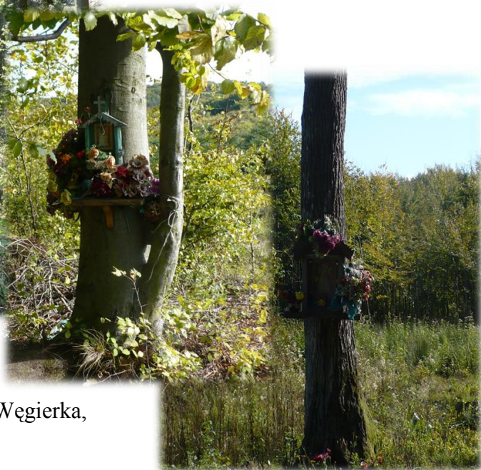
Fot. Drewniane kapliczki w leśnictwie Węgierka, oddz. 64a, 65a.