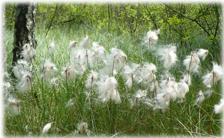
Fot. Wielnianka wąskolistna Eriophorum angustifolium