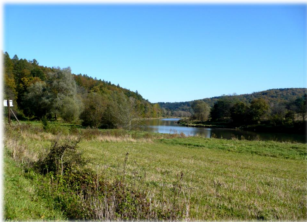
Fot. Przełomowy odcinek Sanu w rejonie Słonnego.

W dolinach rzek i potoków zachowały się stosunkowo mało przekształcone niewielkie fragmenty bogatych gatunkowo lasów łągowych.