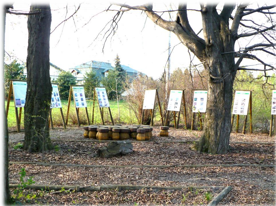
Fot. „Zielona klasa” przy siedzibie Nadleśnictwa – tablice edukacyjne oraz miejsce wypoczynku.