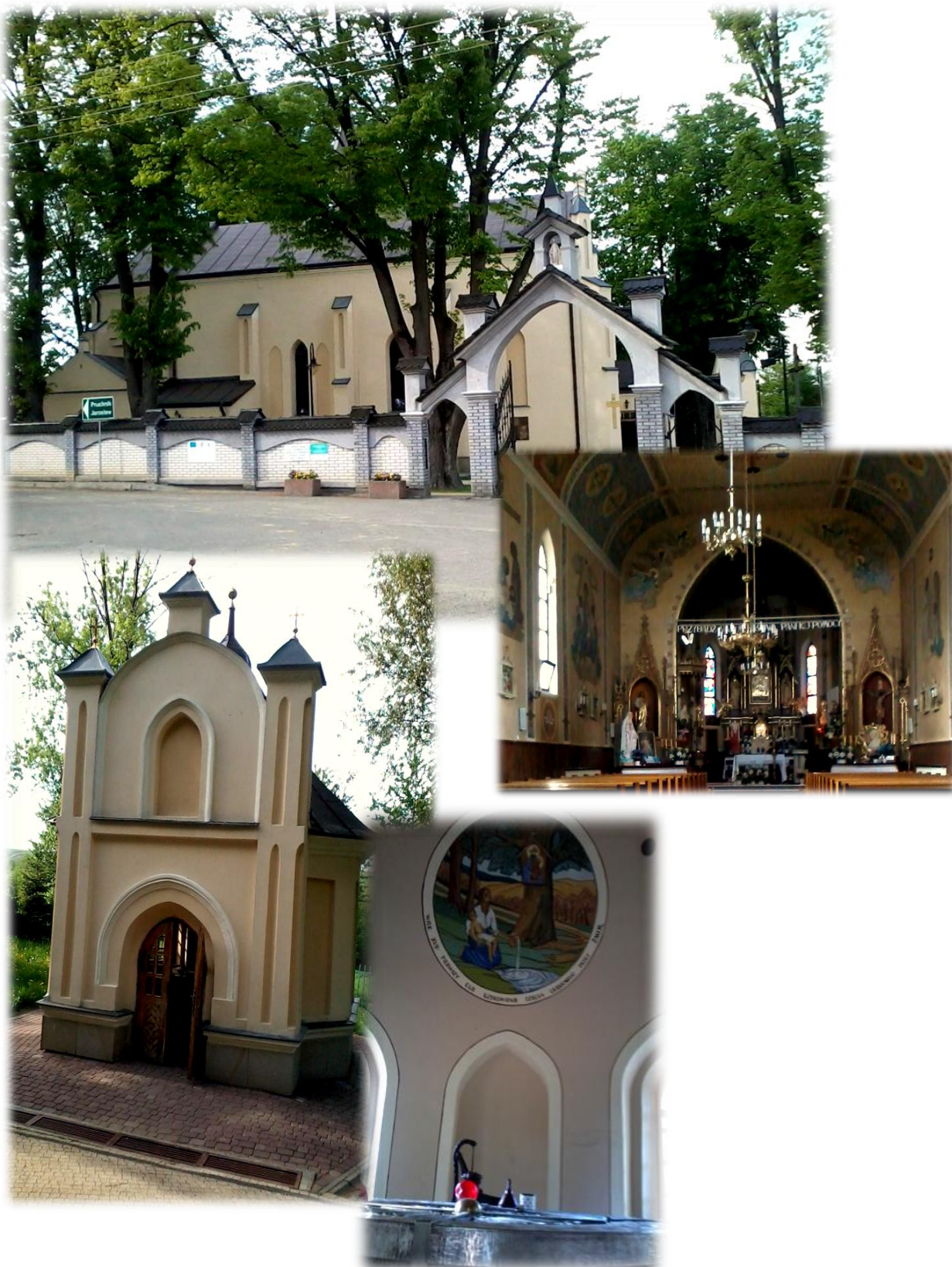
Fot. Sanktuarium Matki Bożej Pocieszenia w Jodłowiec położone na wzniesieniu zwanym Górą Świętej Marii, skąd wypływa źródło, którego wodę od dawna uważano za uzdrawiającą.