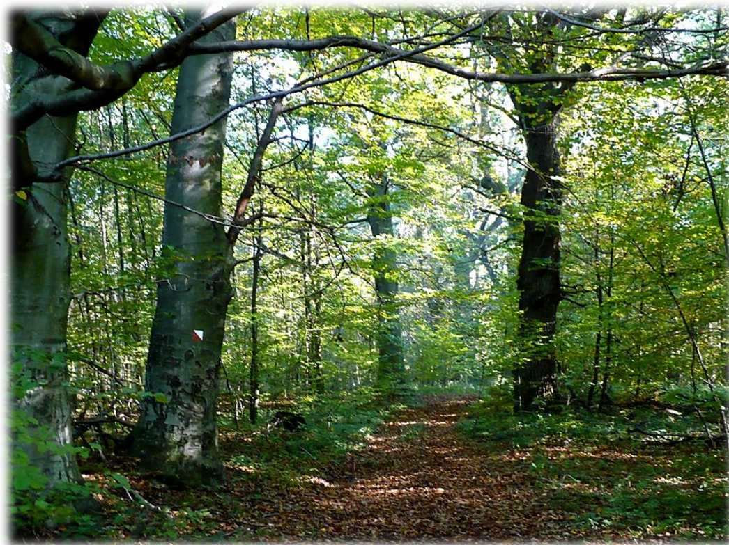
Fot. Aleja pomnikowych drzew (28Db, 3Bk) w oddz. 252b/d.

W zasięgu administracyjnym Nadleśnictwa (grunty obce - gmina Dubiecko, miejscowość Bachórzec) położony jest rezerwat torfowiskowy „ Broduszurki ”. Utworzony został w 1995 roku, a jego powierzchnia wynosi 25,91 ha.