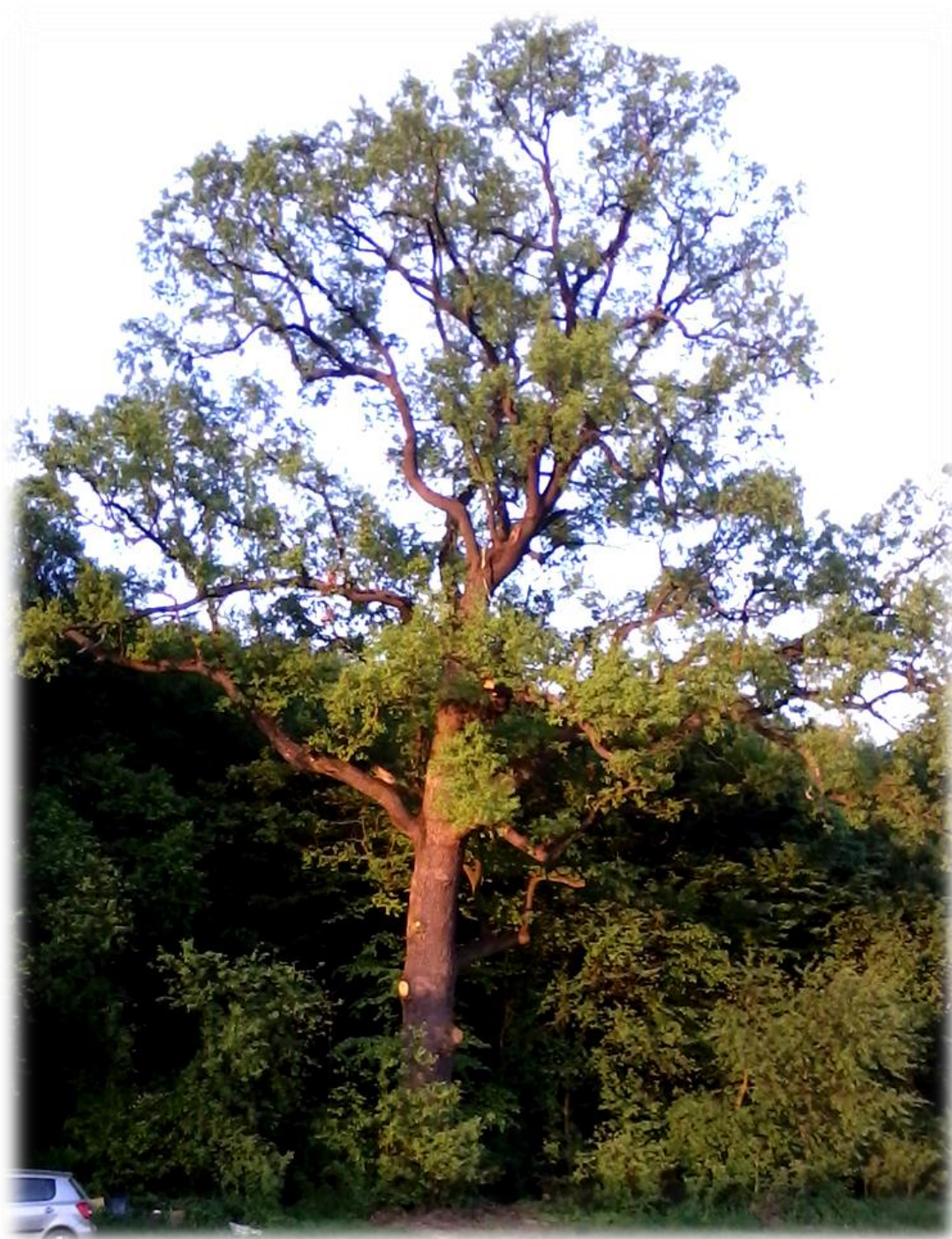
Fot. Dąb szypułkowy o obwodzie 503 cm, wysokości 27 m, leśnictwo Roźwienica, oddz. 10d;