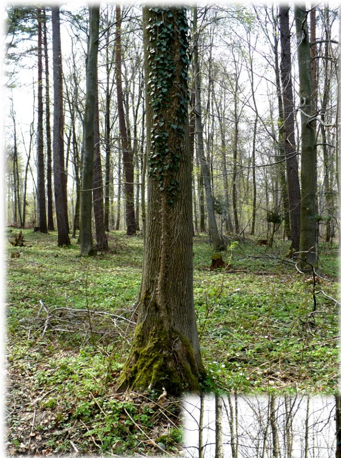
Fot. Forma pnąca bluszczu pospolitego Hedera helix leśnictwo Rączyna, oddz. 140d